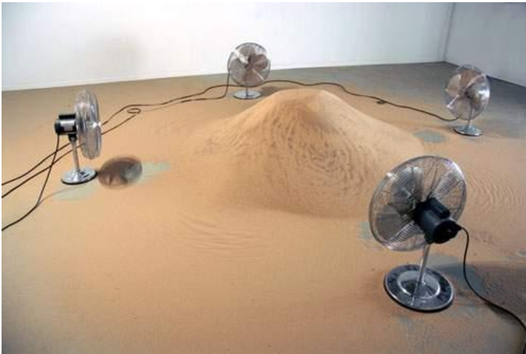
Alice Aycock, Písek/Ventilátory