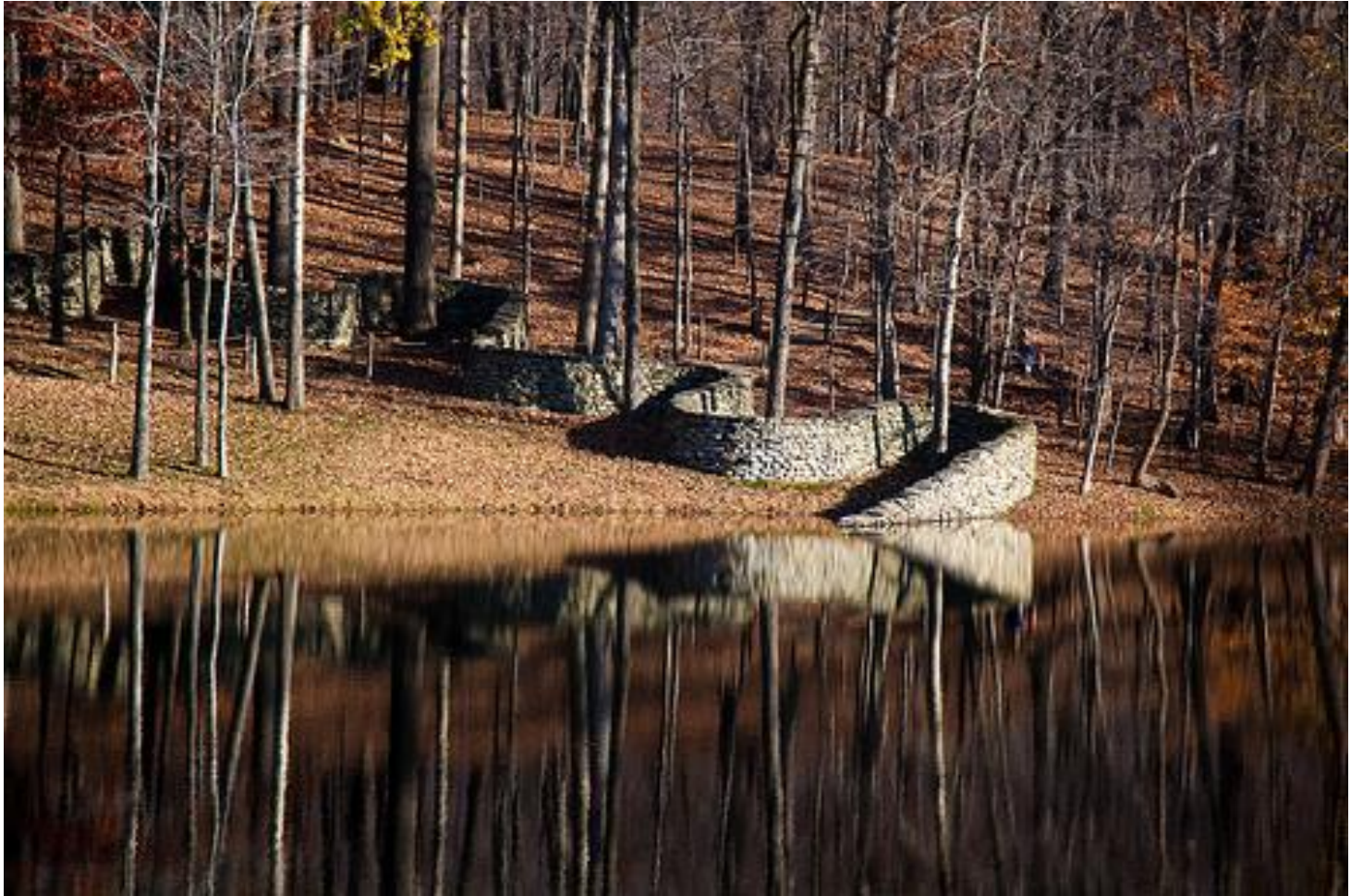
Andy Goldsworthy, Zed' ve Storm King