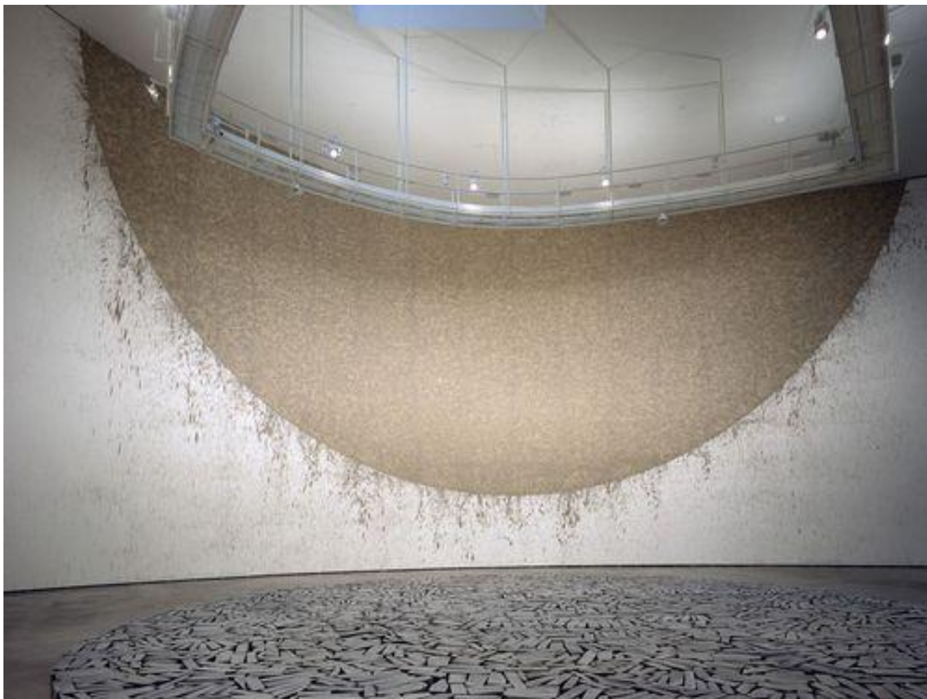
Richard Long, Blátivá malba