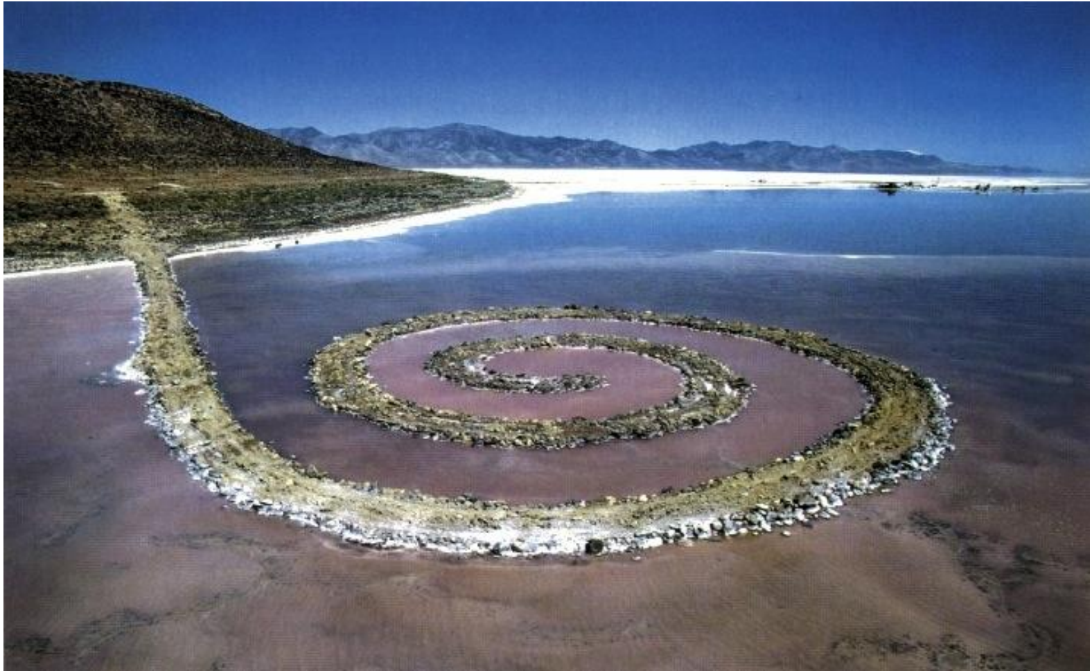
Robert Smithson, Spirálové molo