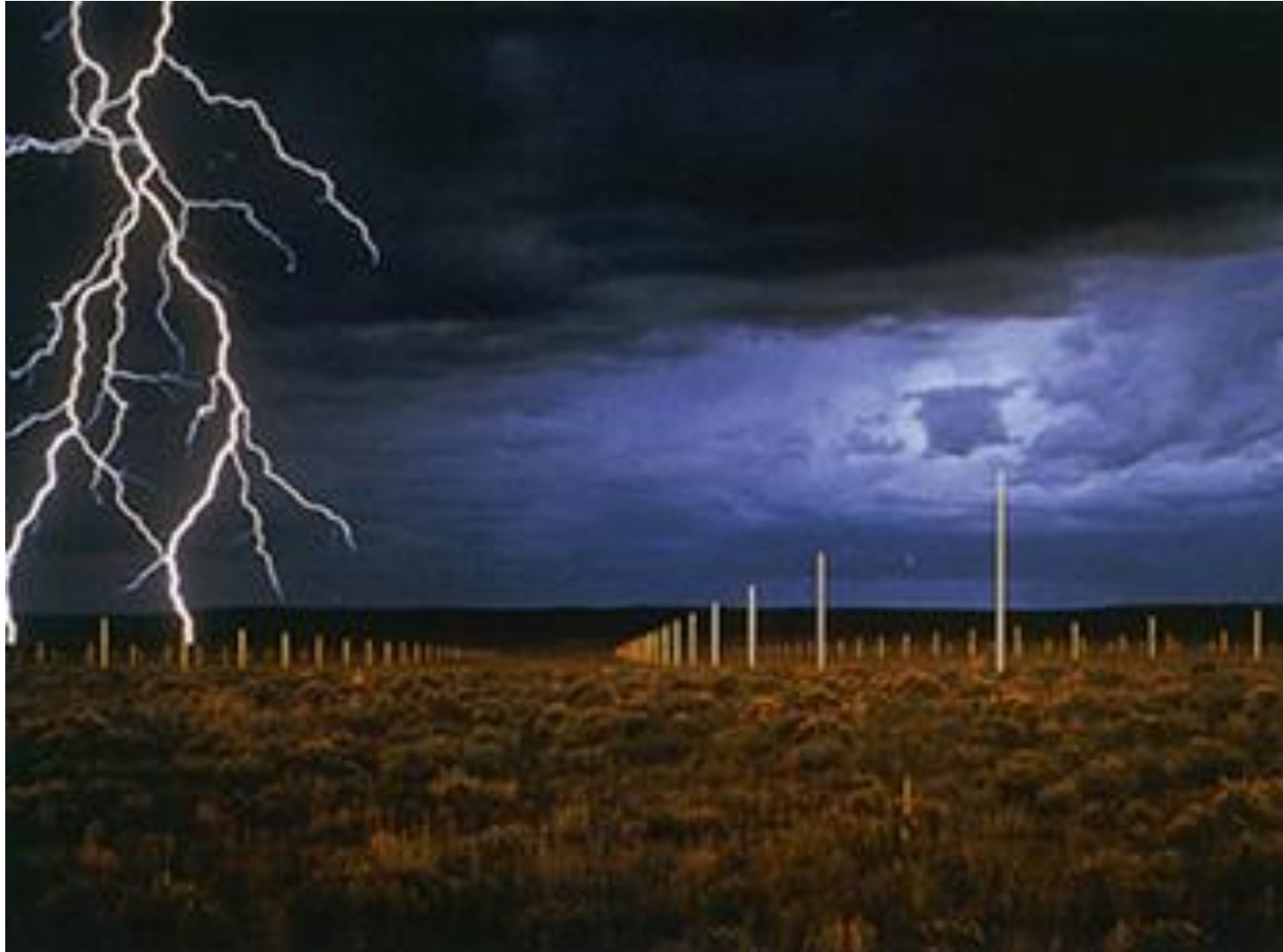
Walter de Maria, Pole blesků