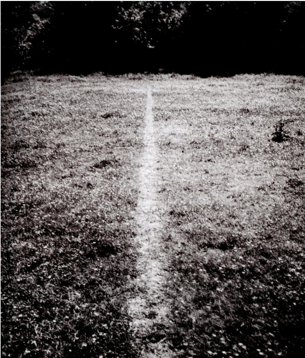
Richard Long, Čára vytvořená chůzí