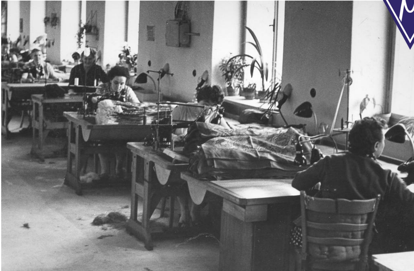
Obrubování šátků v Novém Městě pod Smrkem (70. léta)