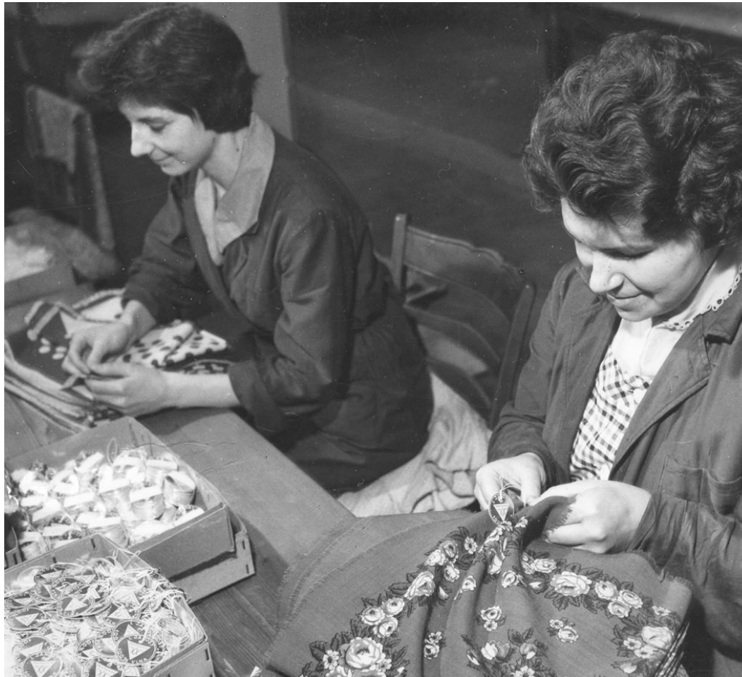
Adjustace vlněných šátků (třepeň) v Novém Městě pod Smrkem (70. léta)