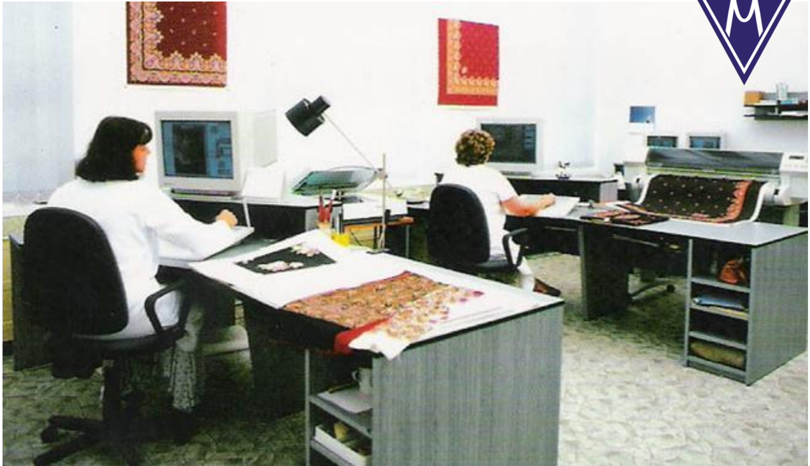
Desinatura tisku v Novém Městě pod Smrkem