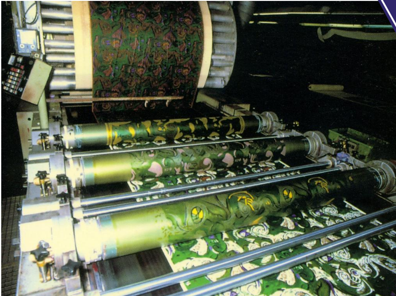
Rotační tisk v Novém Městě pod Smrkem (firma Buser)