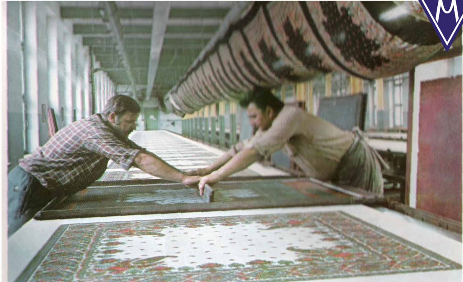
Tisk vlněných šátků v Novém Městě pod Smrkem (80. léta)