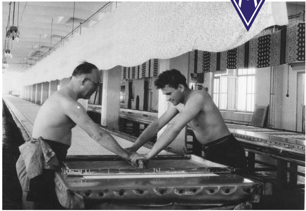
Tisk vlněných šátků v Novém Městě pod Smrkem (70. léta)