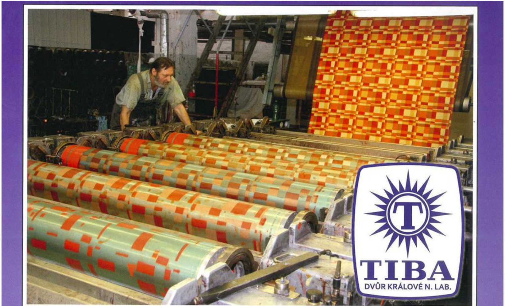
Rotační tisk ve Dvoře Králové