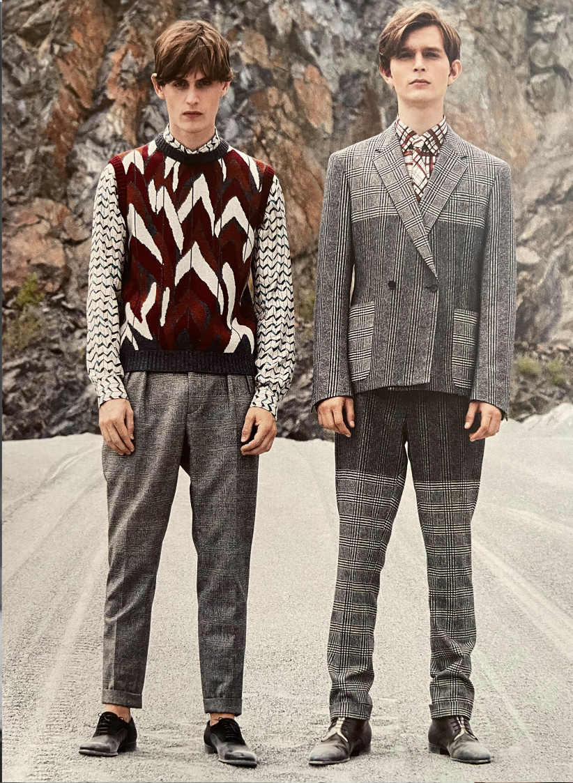
Total look Ecco Unltd, shoes Premiata