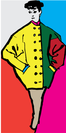
objekty v ilustrátoru