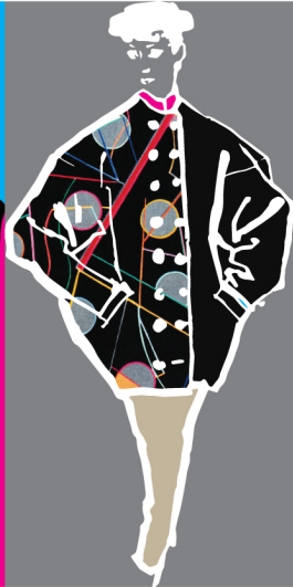
hra s různými nafocenými materiály (obrázky jsou ilustrační - připravte si pouze vlastní tvorbu !!)