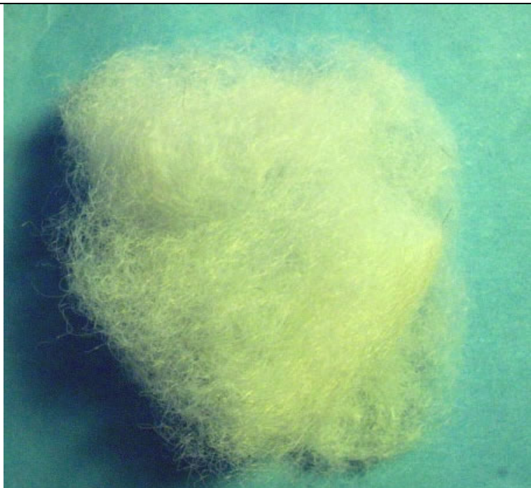
Vlněná vlákna (česanec)