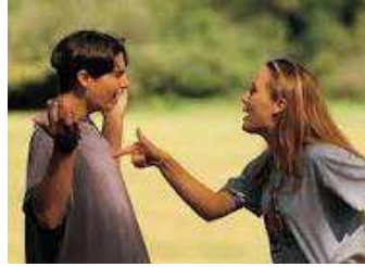
obr. 7, ilustrace textu ( www.google.cz/komunikace )

Rogers považuje komunikaci za jednu z nejdůležitějších aktivit a uvádí, co je třeba dělat pro to, aby se jedinec cítil mezi lidmi dobře.