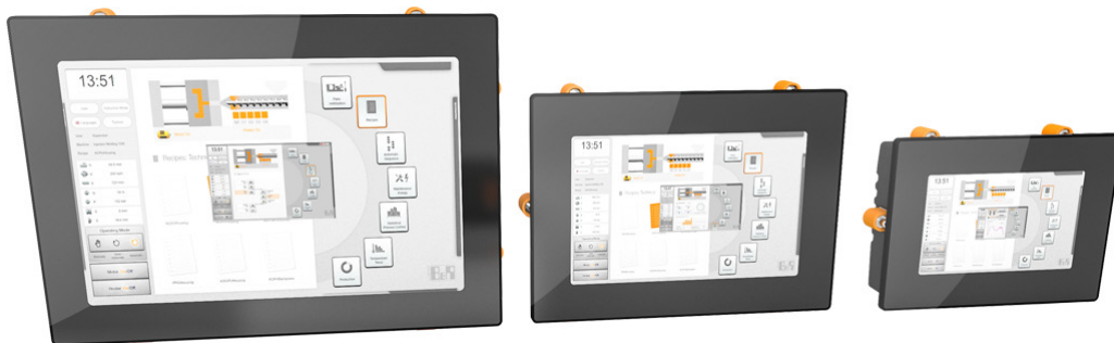
Obrázek 3: Příklad PLC automatu řady C70 .

Všechny tři řady nemají integrované žádné vstupy/výstupy, disponují pouze rozhraním komunikačních sběrnic X2X-link nebo Ethernet POWERLINK , popř. CAN . Požadované vstupy a výstupy se k těmto PLC připojují pomocí těchto sběrnic jako vzdálené IO .