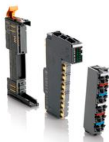
Obrázek 4: Ukázka sestavení jednotlivých komponent I/O modulu řady X20 .

Toto řešení umožňuje v případě nutnosti rychle vyměnit pouze nefunkční modul elektroniky bez nutnosti odpojování a připojování vodičů.