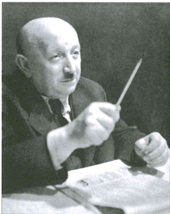
Rudolf Beran – předseda nejsilnější Republikánské (agrární) strany – profilující politická osobnost druhé republiky.

Na převzetí iniciativní role v procesu zjednodušování politického života si dělalo ambice hned několik politických subjektů. Spolu s Národní ligou J. Stříbrného se ohlásilo se svými nároky již v prvních říjnových dnech roku 1938 i Národní sjednocení. Jeho předsednictvo považovalo za hlavní úkol zabezpečit „ryzost národního života ve slovanském státě Čechů, Slováků a Podkarpatorusů“, za neméně důležitou označilo nutnost „bránit stát před cizími živly, zabezpečit práci a výdělky všem vrstvám lidu“. Příkazem doby se podle nich stala potřeba „soustředit politické strany“. A v této fázi si představitelé Národního sjednocení, plni sebevědomého uspokojení, nárokovali čelné místo v tomto procesu: „Jestliže naše politická pravda došla dnes všeobecného uznání, není důvodu, aby politická strana, která byla jejím nositelem a hlasatelem, rezignovala na svou