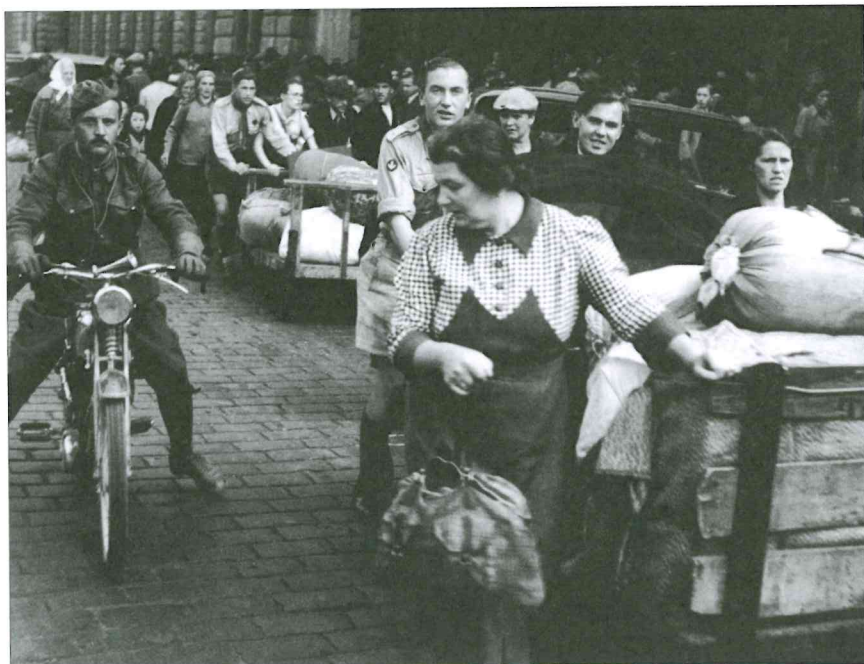
Útěk českých uprchlíků ze zabraného pohraničí do vnitrozemí druhé republiky

vědnost. Z pravé strany politického spektra sílily stále méně zastřené útoky především na praktické výsledky politiky skupiny Hradu a na dosavadní vládní koalici. V očích veřejnosti totiž představovaly dva hlavní opěrné sloupy dosavadního parlamentního demokratického systému a z něho vyplývajícího způsobu vlády. To, že se záměrně opomíjely, zastíraly a přecházely rozhodující vnější mezinárodně politické vlivy, role západních appeaserů a zvláště hitlerovského Německa při přijetí mnichovského řešení, vyplývalo z obav, že „nová“, okleštěná republika při nepříznivé konstelaci nemusí dosáhnout garancí nových hranic, a z řady důvodů se proto považovalo za nevhodné až netaktické dráždit velmoci.