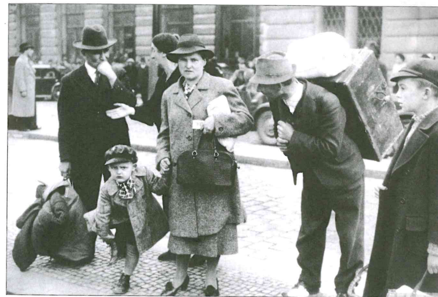
Snímky zachycující útěk českých uprchlíků ze zabraného pohraničí do vnitrozemí druhé republiky.