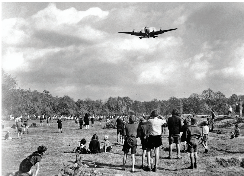
Berlínské děti čekají na sladkosti, které jim shazovali američtí vojáci z letadel přistávajících na letišti Tempelhof během berlínské blokády

poté k 1. 1. 1953 disponoval celkem 5,4 mil. připravených mužů. 1 Takovou sílu tehdy neměl nikdo k dispozici. Stále provokoval, zkoušel odpovědnost i odvalu demokratických politiků celého světa, vyvolal krizi, vyčkával a nakonec potichu ustoupil, což všechny mátl. Prvním takovým střetem byla první berlínská krize. Hlavním Stalinovým cílem byla destabilizace německých poměrů a průnik komunistů i do ostatních okupačních pásem v Německu. Dobýt Německo pro komunismus byl jeho celoživotní sen, dá se říci, že ho zdědil po Leninovi, jenž byl přesvědčen, že bez vítězství komunismu v Německu nemá sovětský komunismus v Rusku šanci na přežití (Stalin usoudil, že je to podmínka světového vítězství komunismu). Leninův plán tažení do Evropy byl připraven v létě 1920, zastavil ho Pilsudski s polskou armádou v památné, dodnes nedocenené bitvě u Varšavy. Nyní Stalin cítil novou příležitost – byly již tři roky po válce a jemu se zdálo, že velkolepá šance mu uniká