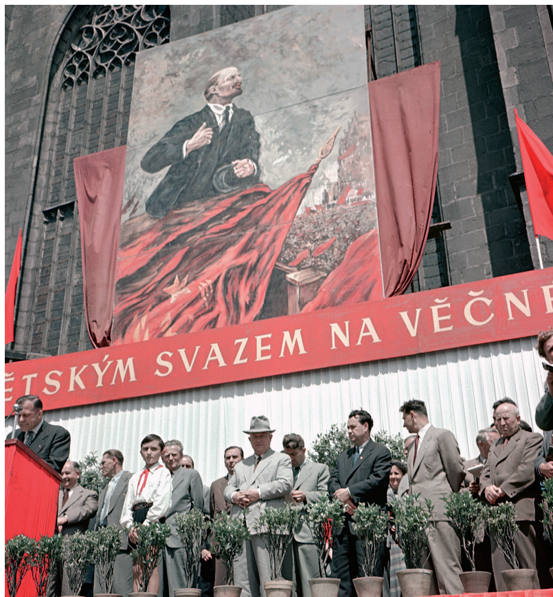
Vítězný Chruščov na přátelské návštěvě v Plzni (uprostřed s kloboukem na hlavě, po jeho pravé ruce Antonín Novotný)

Není žádnou zvláštností, že vládní hry, přesněji boje o moc, umožňují občanské společnosti volněji dýchat. Politici se přece jen snaží o populární prohlášení, navzájem se urážejí a obviňují z různých hříchů a mezi lidmi vzniká dojem možného svobodnějšího