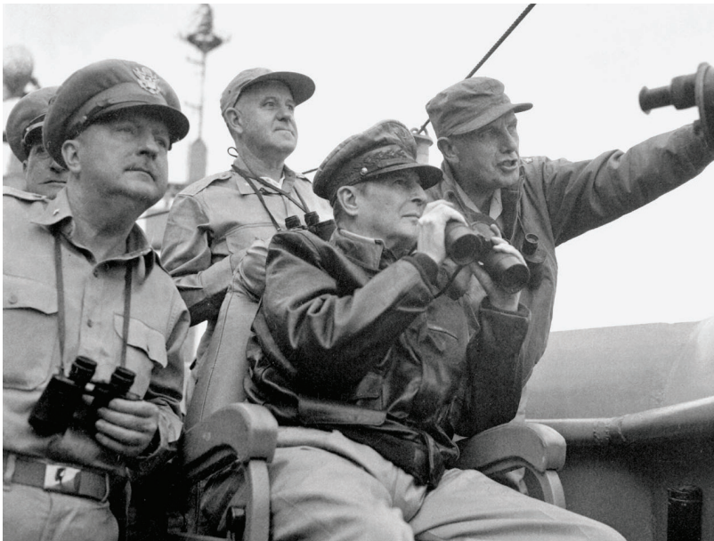
Generál Douglas MacArthur sleduje vylodování u Inčchon u bitevní lodi USS Mount McKinley, 15. září 1950

Útok severokorejských vojsk začal 25. června 1950. Zdůvodněn byl jako preventivní úder proti agresorům z jihu (komunistická propaganda i historici toto prohlášení vyhodnotili tak, že útok vlastně zahájila Jižní Korea, což platilo za bernou minci v komunistickém světě skoro čtyřicet let). Píše se, že jihokorejský venkov, který marně očekával masivní pozemkovou reformu, Kim Ir-senova vojska vítal, pravděpodobně tomu tak opravdu bylo, ale tato argumentace sloužila především k objasnění toho, že útok Severní Koreje byl neobyčejně úspěšný – během několika týdnů dobyli severokorejští vojáci celou Jižní Koreu, až na dvě malá předmostí. O jedno z nich, Pusan, se navíc zasloužil americký generál MacArthur, který velel americkým jednotkám v Japonsku: v červenci 1950 sem poslal vojenskou pomoc včetně tankových jednotek. Mezitím horečně, i když s obvyklým pomalým rozmyslem, jed-