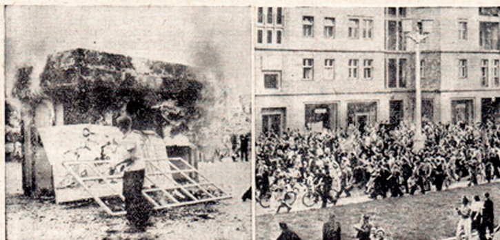
Vlevo: Znamení potupy — komunistické plakáty — byly strženy a stánky s komunistickými tiskovinami spáleny. Vpravo: Stalinallee, kde stavební dělníci demonstrace 16. června ráno začali, se stala revolučním bojištěm na němž padla bajka o lidovosti komunistických režimů.

Leták Svobodné Evropy informující o událostech v NDR v červnu 1953