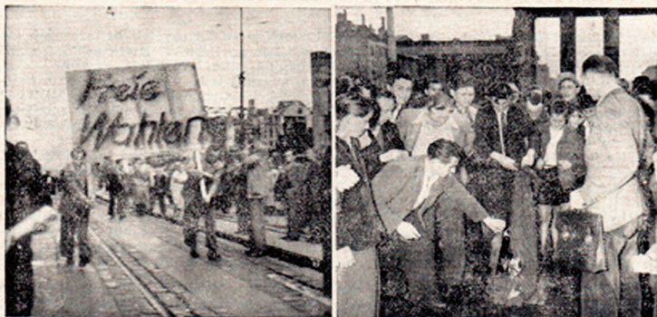
Vlevo: Berlínští demonstranti žádali svobodné volby — cestu ke svobodě. — Vpravo: Sovětská vlajka, stržená s Braniborské brány, skončila v plamenech.

Od 16. června, kdy východoberlíňští dělníci povstali proti německé loutkové vládě, celé Sověty okupované Německo se ocitlo ve varu. Spolu s červnovými bouřemi v Československu tyto spontánní projevy vůle lidu ukázaly slabost komunistických režimů a sílu lidu v rostoucím odporu proti tyranům.