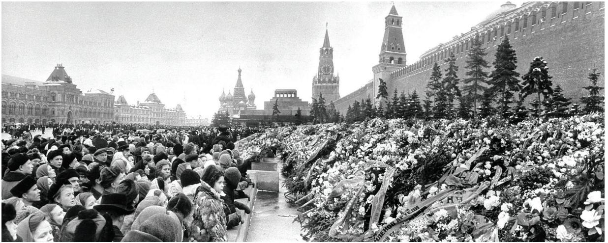
Davy sovětských občanů oplakávají Stalina na Rudém náměstí v Moskvě, 10. březen 1953