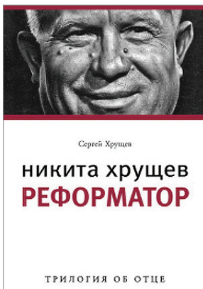
Obálky knih citovaných v textu

Mohlo by se tedy zdát, že všechny otazníky kolem palácového převratu