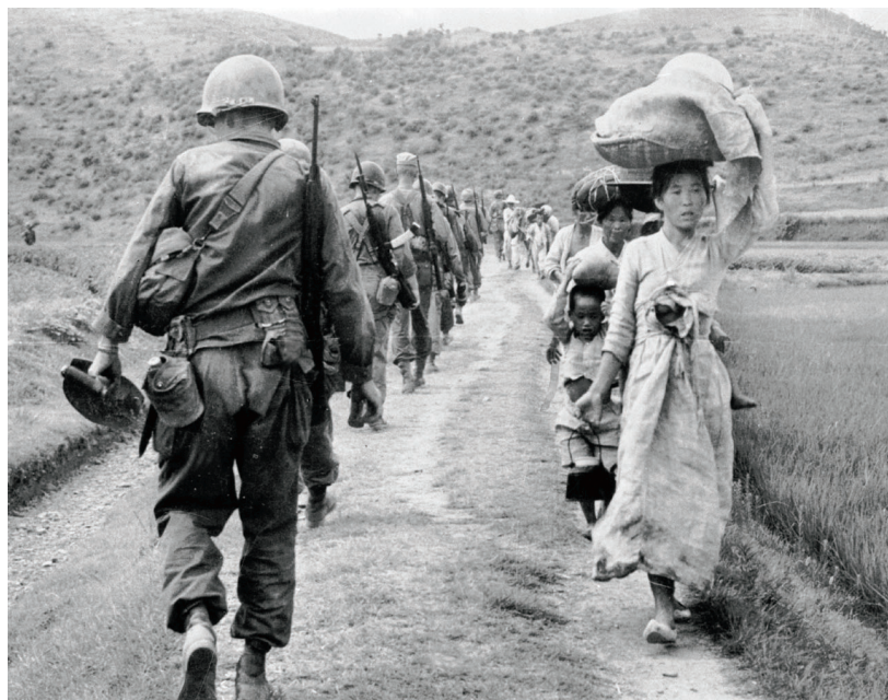
Američtí vojáci v Koreji (srpen 1950)

Je skoro jisté, že Stalin začátkem roku 1952 usoudil, že s politikou třetí světové války (a následným vítězstvím komunismu ve světě) neobstojí a není schopen ji realizovat. Pochopil, že ve vojenských závodech (ve zbrojení) neudrží krok a soupeření mu může připravit nečekaná překvapení, včetně vnitřních nesnází a vnější porážky. V Evropě chtěl zabránit integračním tendencím a narušit NATO, nehodlal opustit tak snadno svůj „německý sen“, a protože chtěl získat čas, navrhl jednání. Dne 10. března 1952 předložil svým bývalým spojencům „mírovou“ nótu o Německu. 5 Vlastně to byl návrh mírové smlouvy, chtěl Německo sjednocené (na základě „svobodných voleb“, ale ty sliboval např. i v Polsku), neutrální (všechna vojska měla z Německa odejít do jednoho roku, jenže Američané neměli v Evropě kam jít a museli by se vrátit domů, Sověti by se přesunuli jen o 150 kilometrů dál, do Polska). Většina formulací však byla vágní, jak měli komunisté ve zvyku (např. zákaz organizací „nepřátelských demokracií a zachování míru“), a hlavně, Spojenci Stalinovi nevěřili. Odpověděli nótou 25. března, každý sám za sebe, ale v zásadě shodnou. Podpořili sjednocení Německa, odmítli neutralitu, akceptovali svobodné volby, ale připojili další požadavky, například okamžité zavedení svobody sdružování, svobody slova apod. V podstatě dohodu odmítli, Stalin však reagoval překvapivě smířlivě. Jeho odpověď přišla 9. dubna a tak jako v dalších nótách ustupoval (na odmítavou spojeneckou