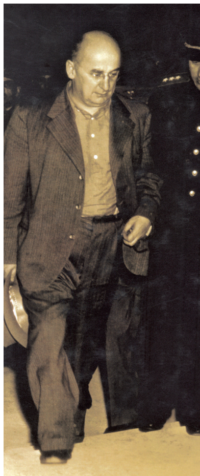
Berija – jen krátce (sto dní) po Stalinově nejmocnější muž v Sovětském svazu

nocného ministerstva vnitra – samostatné ministerstvo bezpečnosti bylo zrušeno?) a dalšími v téže funkci byli Kaganovič, Molotov (nově i ministr