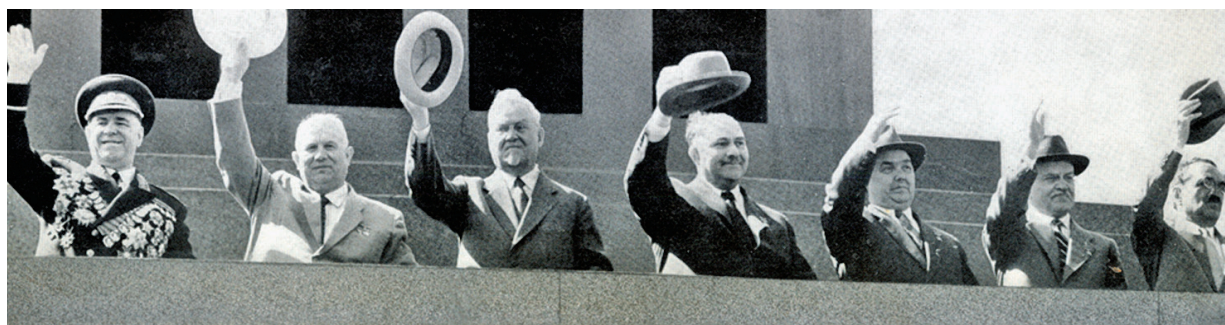
Vítězné poststalinské kolektivní vedení SSSR, z něhož se postupně vyvíjel Chruščov (zleva Žukov, Chruščov, Bulganin, Kaganovič, Malenkov, Molotov, Mikojan)

Chruščova, 16 ale protože existuje několik verzí, lišících se v detailech, musíme průběh jen odhadovat. Malenkov prý byl tak vystrašený, že sotva mohl mluvit, ač byl předsedajícím celého zasedání, hlavní slovo měl Chruščov, který hned v úvodním vystoupení, kdy se hovořilo o programu zasedání, obvinil Beriju ze všech možných hříchů jako bývalého agenta britských tajných služeb (z doby těsně po první světové válce) a z přípravy převratu po Stalinově smrti, vyhocoval argumenty do smrtelné obžaloby typu „chtěl nás všechny zatknout a postavit na popraviště, aby mohl vládnout sám“ apod. Po něm údajně mluvili Bulganin, pak Molotov, a protože bylo zvykem, aby se vyjádřili všichni přítomní, zřejmě promluvili i další, ale o jejich vystoupení Chruščov jen neadresně uvádí, že byla méně rozhodná. Jen Mikojan údajně Beriju hájil pro jeho pracovitost a výkonnost a nesouhlasil s Chruščovovým návrhem vyloučit ho ze všech orgánů i ze strany. Berija byl jistě zaskočen (nedostal své pověsti všemocného policajta), takový průběh rozhodně nečekal, zprvu jed-