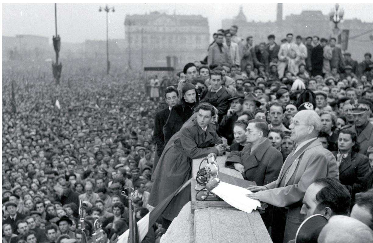
Władysław Gomułka promlouvá k davu 24. října 1956