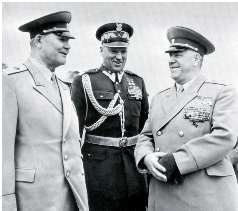
Zleva – maršál Sovětského svazu Ivan Stěpanovič Koněv, náměstek předsedy Rady ministrů a ministr národní obrany, maršál Polska Konstantin Rokossovskij a ministr obrany SSSR Georgij Konstantinovič Žukov ve Varšavě, 13. května 1955

mi stoupenci i požadavek odvolání Rokossovského a všech sovětských poradců ze země. 14