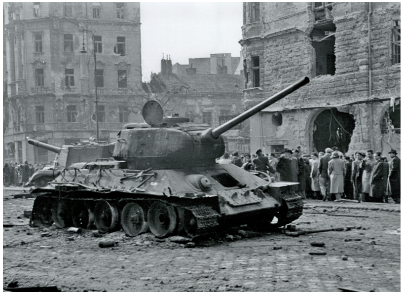
Zničený sovětský tank na jednom z budapeštských bulvárů na konci října 1956

Události v Polsku a především brutální potlačení povstání v Maďarsku byly nepochybně pro země východního bloku lekcí. 59 Z pohledu organizace Varšavské smlouvy předně ukázaly, že základní alianční pravidla existují pouze na papíře a budou dodržována, dokud to Sovětský svaz uzná za vhodné. V případě PLR došlo k porušení článku VIII. garantujícího spolupráci členských zemí na základě zásady vzájemného respektování nezávislosti, svrchovanosti a nevměšování se do vnitřních záležitostí druhého státu. Operace „Vichr“ byla jednoznačně