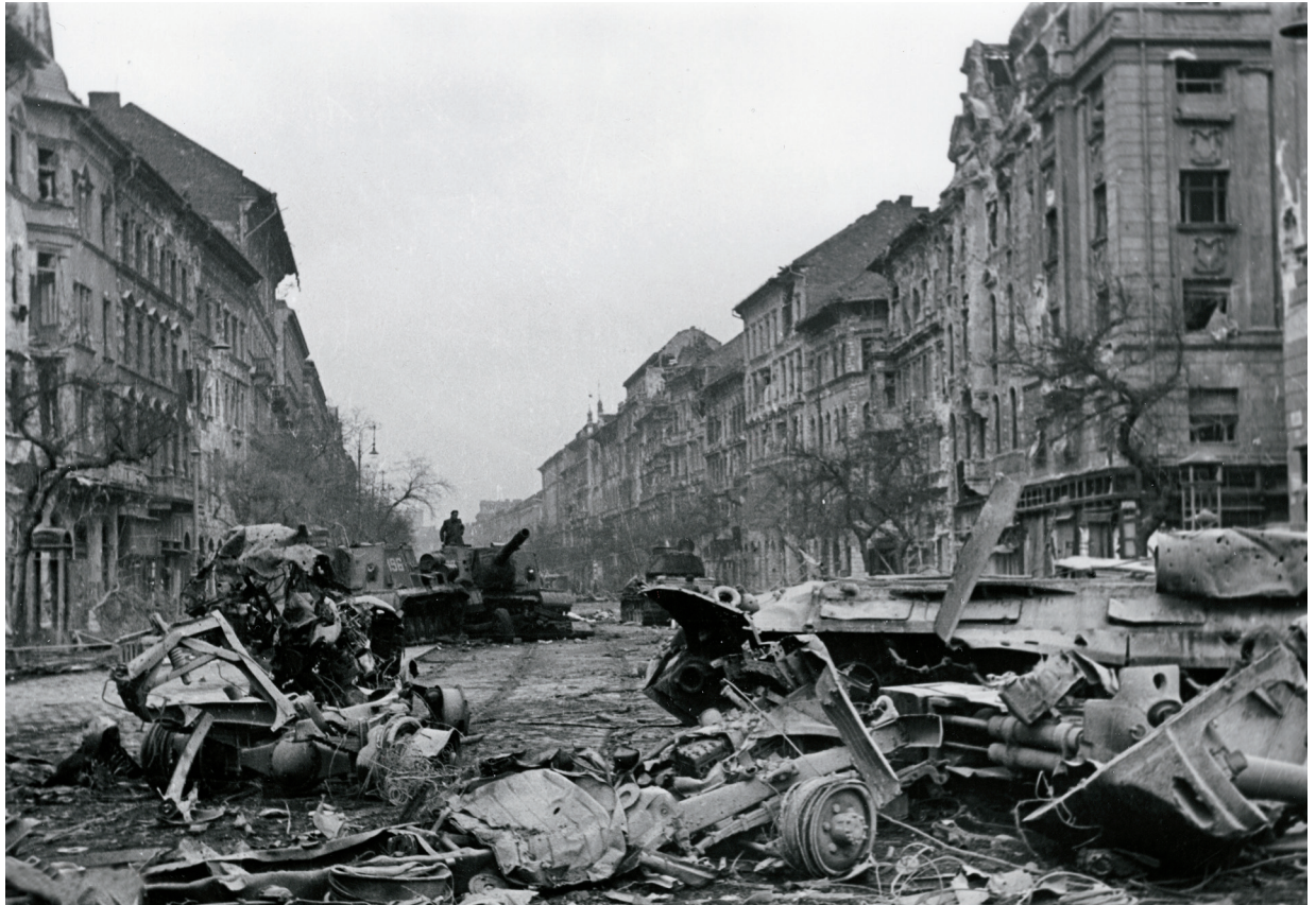
Následky sovětského zásahu v Maďarsku