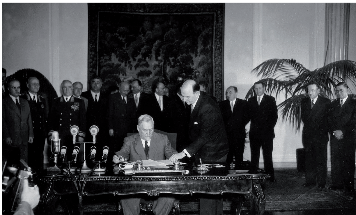
Vedoucí sovětské delegace, předseda Rady ministrů SSSR Nikolaj Alexandrovič Bulganin podepisuje smlouvu na varšavské konferenci evropských států o zajištění míru a bezpečnosti v Evropě, 14. května 1955