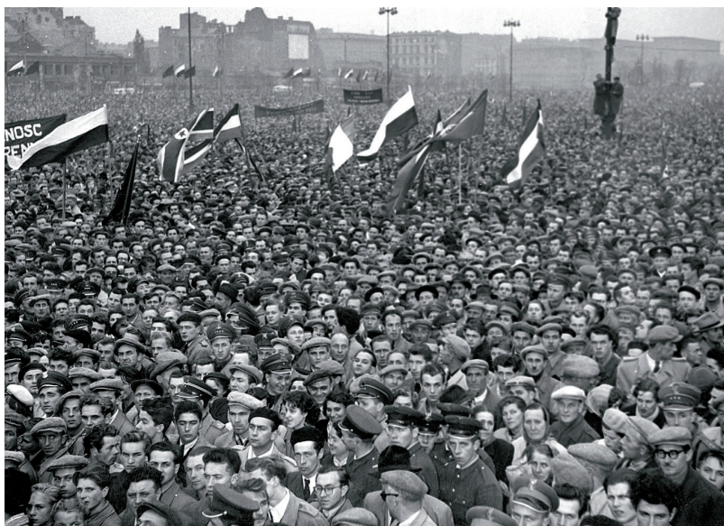
Manifestace ve Varšavě, 24. října 1956

Pro zastavení ozbrojené sovětské intervence existovalo několik pádných důvodů. Kremleští představitelé si předně uvědomovali, že polská armáda, nebo minimálně její větší část, by se s největší pravděpodobností sovětským jednotkám postavila na odpor. Sovětské vojenské velení