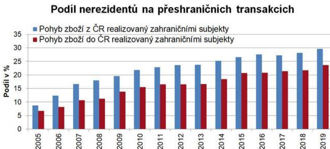
Obr. 1.2 Podíl nerezidentů na přeshraničních transakcích

nerезidentů na přeshraničních transakcích. Z něj vyplývá rostoucí podíl na obchodu realizovanými nerezidenty.