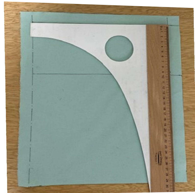
Kontrola pravoúhlé konstrukční sítě.