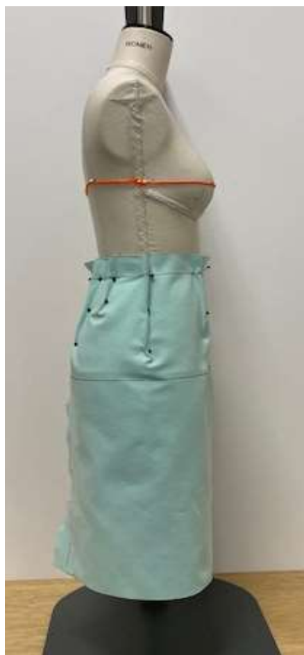
Pohled z boku