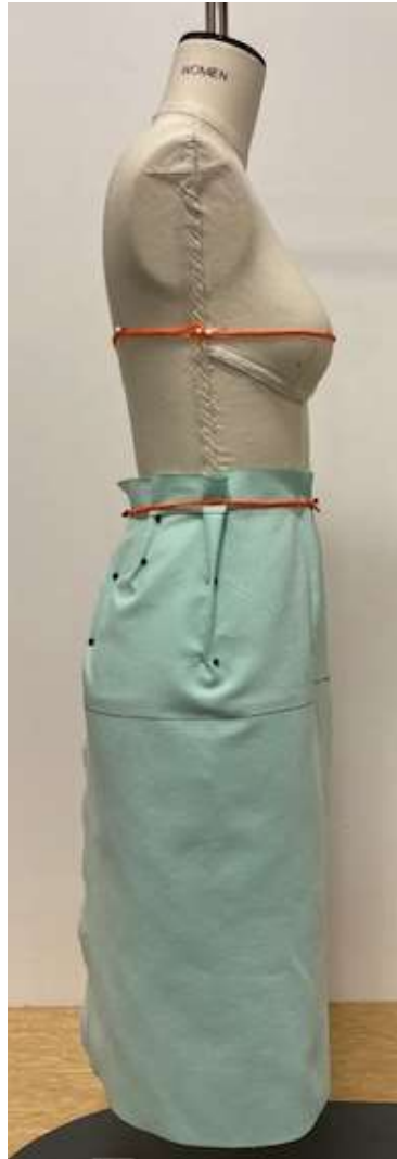
Pohled z boku