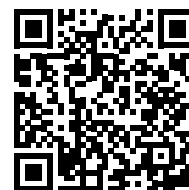
Podrobné informace k sektoru

Pandemie přiměla konzervativní japonské úřady i firmy k přechodu na intenzivní on-line provoz. Zvýšila se potřeba zajistit IT technologie, jako je kybernetická bezpečnost, zpracování velkého množství dat, monitoring sítí nebo kvalitní lokalizační a překladatelské programy. Jen v roce 2021 nárůst prostředků do IT vybavení vzrostl o 16%. K dalším perspektivním odvětvím ICT lze zařadit také oblast internetu věcí, umělé inteligence, efektivního řízení municipalit a jejich kompletní infrastruktury (smart cities) nebo e-commerce.