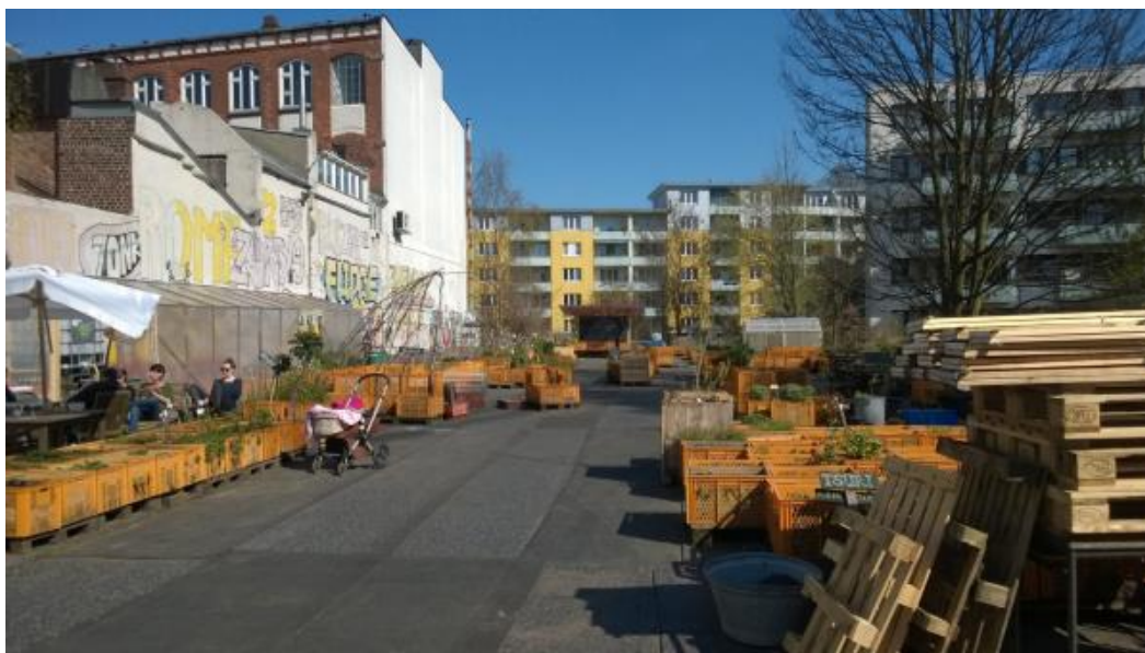
Obr. č.1: Komunitní zahrada Gartendeck, Sankt Pauli, Hamburk

Nové městské zahrádky jsou charakteristické tím, že jsou interkulturní, mnohé z projektů se například snaží zapojit početnou tureckou komunitu, která v Německu žije. Z hlediska umístění jsou zahrady zakládány například na brownfieldech a také jejich podoba je hodně odlišná od zahrádkových kolonií, nepanuje tu tak přísný řád a pořádek (viz Follmann, Viehoff 2014: 6). Známé jsou například zahrady v berlínské čtvrti Kreuzberg či v Hamburku.