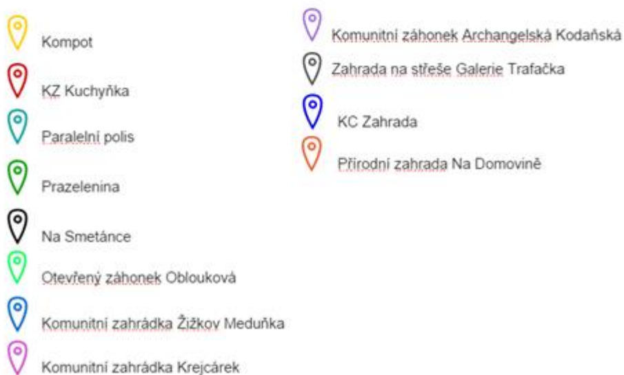
Obr. č.3: Mapa komunitních zahrad zahrnutých do výzkumu

Strukturu zahradníků popsala zakladatelka Komunitní zahrady Smetánka následovně: