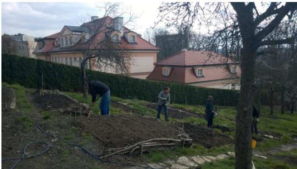
Obr. č.5: Terasovitá políčka pro pěstování v KZ Kuchyňka