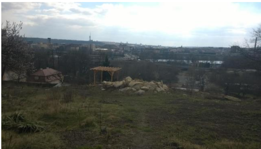
Obr. č.6: Pohled z horní části zahrady KZ Kuchyňka

Nyní se budu věnovat popisu zahrady, jejímu fungování a pozici v prostoru. Myslím si, že zahrada, ačkoli leží na soukromém pozemku, je částečně veřejným nebo přinejmenším poloveřejným prostorem. Toto popisoval například Marcuse, který poukazuje na to, že veřejný prostor, nemusí nutně znamenat veřejně vlastněný, ale spíše prostor, který je veřejně využíván (viz Marcuse 2012: 50). I paní majitelka by byla ráda, aby se prostor více otevíral veřejnosti: