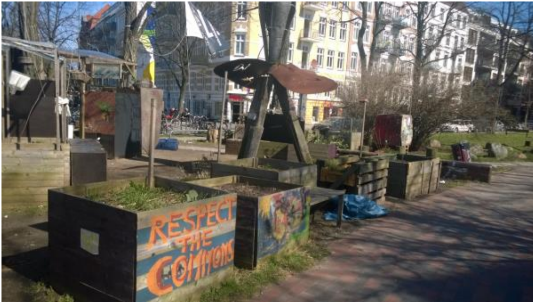
Obr. č.2: Komunitní zahrada Keimzelle, Sternschanze, Hamburk

Pěstování se v zahradách realizuje různými způsoby: může jít například o sdílené pěstování nebo se každý člen zahrady stará o své políčko. Také to, v čem se pěstuje, je dost odlišné od tradičních zahrádkových kolonií. Zahradníci často recyklují různé nádoby, které původně k pěstování vůbec určené nebyly. Ačkoli se jedná o poměrně pestrou škálu projektů, zahradníci našli společné téma a tím je právě právo na přetváření prostoru města, a tak vznikl manifest Stadt ist unsere Garten , který podrobněji zmiňují v kapitole 1.3.