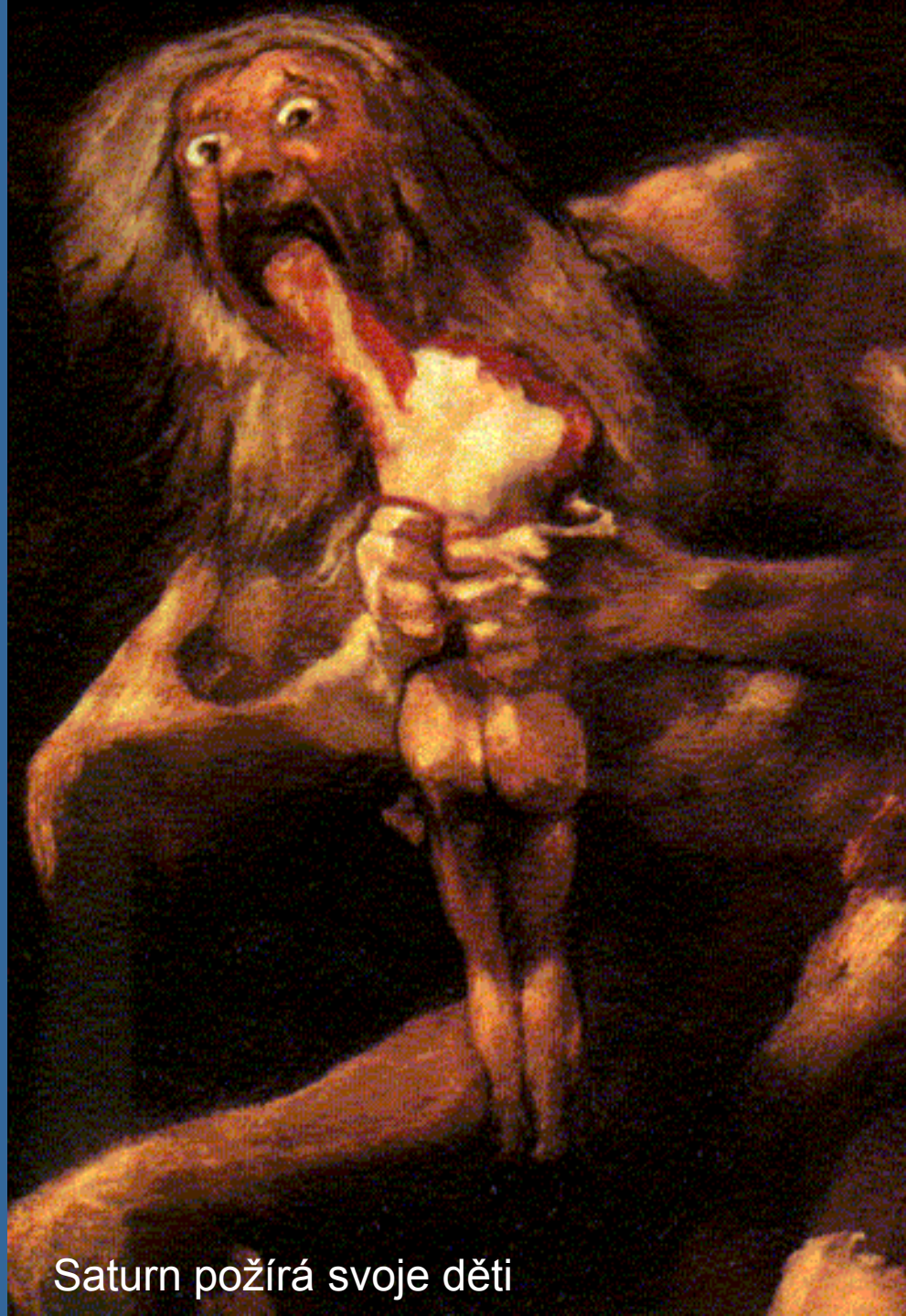
Saturn požírá svoje děti