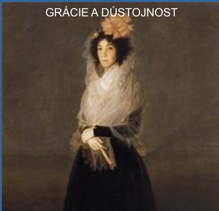
GRÁCIE A DŮSTOJNOST