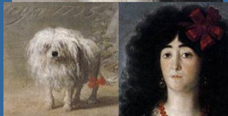
Vévodkyně z Alby - 1795