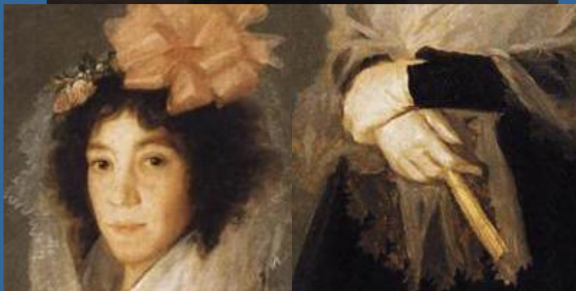
Hraběnka del Carpio, markýza de la Solana 1793 - 1795