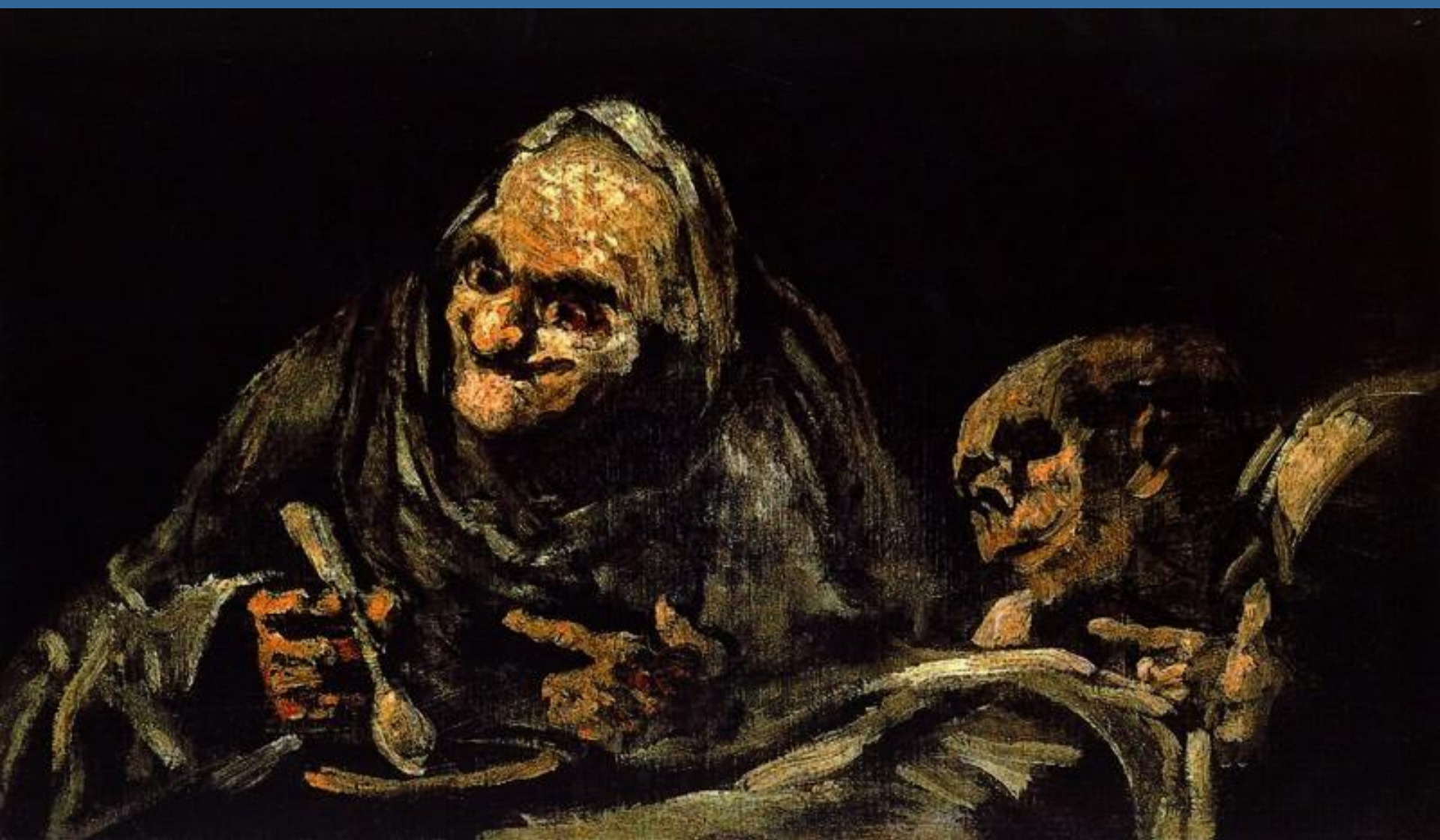
Dvě stařeny pojídající polévku