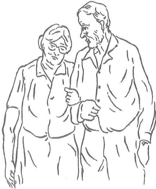
Obr. 4.10 Zákazník typu 10

Odhad = relativně finančně zajištění starší lidé s ochotou utratit „jednou za život“