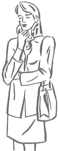
Obr. 4.8 Zákazník typu 8

Odhad = emancipovaná mladá žena v řídicí funkci, ochota utrácet za svou přesnou představu