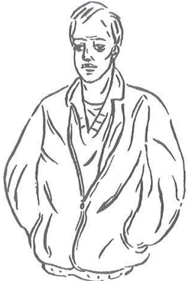
Obr. 4.4 Zákazník typu 4

Odhad = dobré finanční zajištění, ochota utracet za skutečnou kvalitu