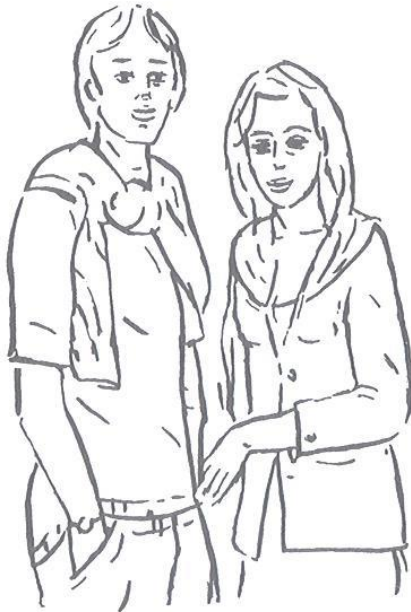
Obr. 4.6 Zákazníci typu 6

Odhad = nedbalá elegance, svobodomyslnost, nechuť vyjednávat, očekávání přiměřené ceny Potřeby = seberealizace, láska, přátelství Nabízené užitky = cena, i neznačková kvalita, styl