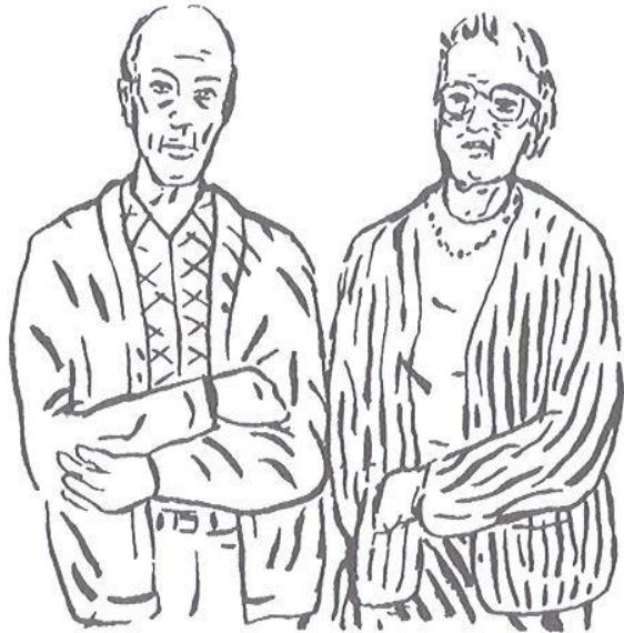
Obr. 4.2 Zákazník typu 2

Odhad = zatrpklí, nespokojení starší lidé Potřeby = základní potřeby, úspora Nabízené užitky = nízká cena i s nízkou kvalitou