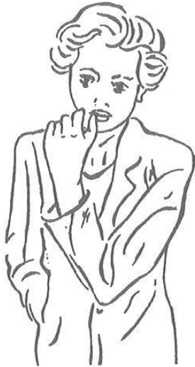
Obr. 4.9 Typ 9. Typ zákaznice orientované na základní potřeby a na potřebu prestiže. Je velmi komunikativní a nechá se snadno přesvědčit

Odhad = nižší finanční možnosti, motiv utrácet více za nižší cenu ale ve stylu