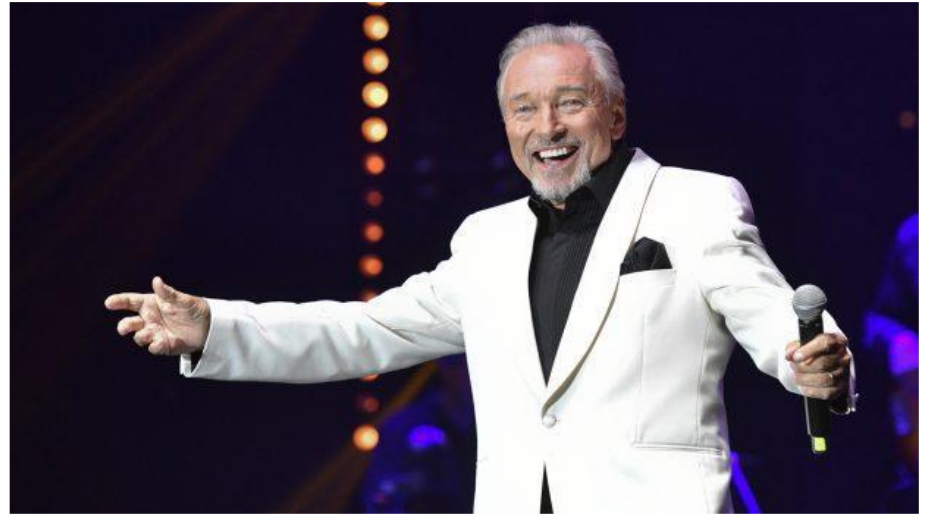
Otevřenost, vřelost, radost