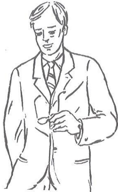
Obr. 4.5 Zákazník typu 5

Odhad = zkušenost, náročnost, ochota utrácet za jistotu vysoké kvality, odstup, nadřazenost