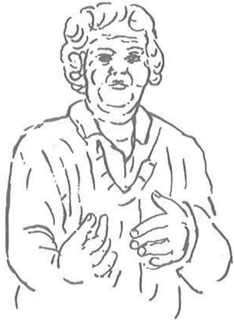
Obr. 4.7 Zákazník typu 7

Odhad = typ hospodyně, za málo hodně, více utratí pouze za spolehlivost Potřeby = základní potřeby s jistotou Nabízené užitky = cena, užitné vlastnosti, hospodárnost, záruční doba