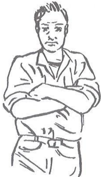
Obr. 4.1 Zákazník typu 1

Odhad = nedůvěra, nepřístupnost, silné ego, arogance, konzervativnost, obava riskovat