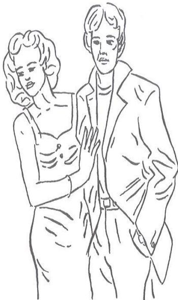
Obr. 4.3 Zákazníci typu 3. Tato dvojice dychtí utrácet za značkové zboží, které jí má dopřát zdání společenského postavení. Uspokojuje si tak potřebu prestiže a společenského uznání

Odhad = dobrý finanční stav, touha utrácet draze kvůli prestiži