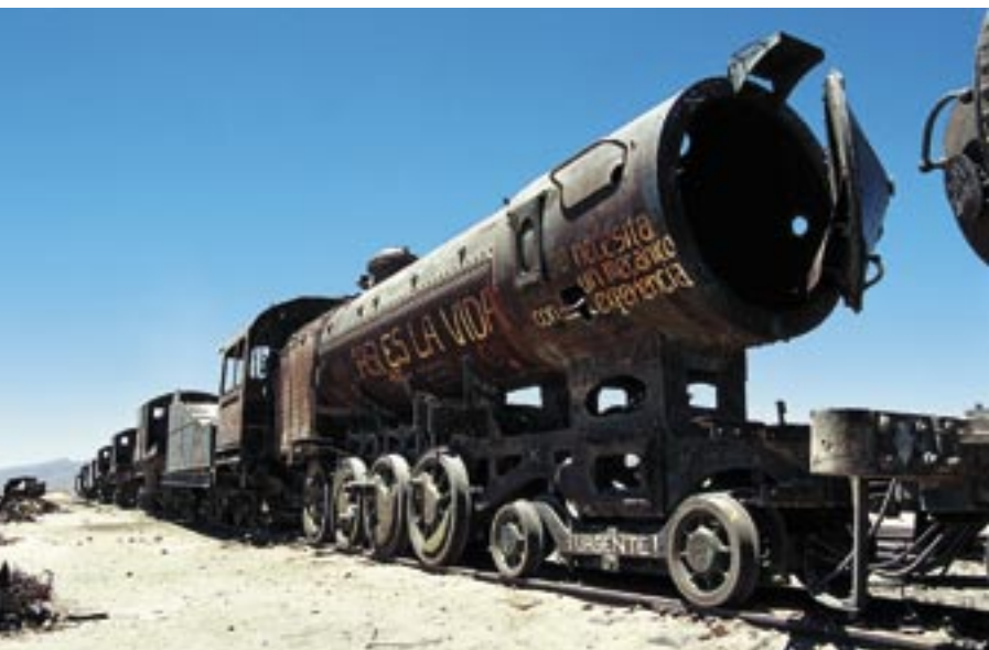
Cementerio de Trenes (hřbitov vlaků) je jednou z atrakcí pro návštěvníky vyrážející na tradiční tříapůldenní okruh po salares. Na dvou kolejích za městečkem Uyuni (3665 m n. m.) se pomalu rozpadají desítky lokomotiv a vagonů, které už neměly kam dál pokračovat v cestě.

menů na sopce Socompa v severním Chile ve výšce přes 6000 m n. m.